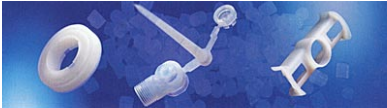
Im Spritzguss hergestellte Teile aus "Moldflon"

Mit dem thermoplastisch verarbeitbaren PTFE "Moldflon" lassen sich Dichtungen auch im Spritzgussverfahren herstellen. Neue Freiheitsgrade in der Formgebung erlauben die Realisierung komplexer Bauteilgeometrien, welche bisher nur sehr aufwändig durch spanabhebende Prozesse hergestellt werden konnten. Zusätzlich kommen auch weitere Vorteile wie der bessere Kaltfluss und geringer Verschleiß zum Tragen.